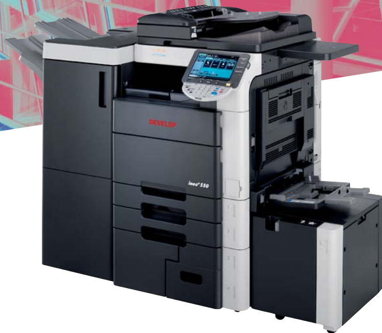
ineo+ 550 com finalizador agrafador (FS-517), cassete de grande capacidade (LU-301) e mesa de trabalho (WT-502)