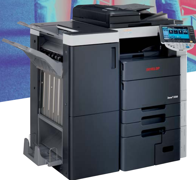
ineo+ 550 com finalizador de brochuras (FS-608)